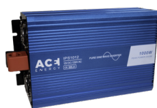
Compatible avec nos convertisseurs DC/AC jusqu'à 1200W.